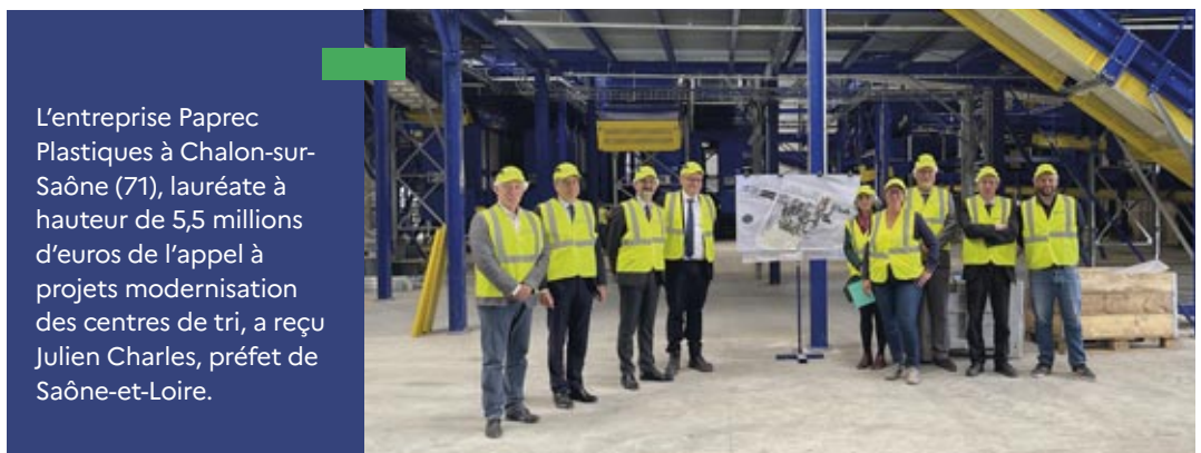
L'entreprise Paprec Plastiques à Chalon-sur-Saône (71), lauréate à hauteur de 5,5 millions d'euros de l'appel à projets modernisation des centres de tri, a reçu Julien Charles, préfet de Saône-et-Loire.

→ PLASTIC RECYCLING (Saint-Eusèbe – 71) , SOCIETE RECYTHERM (Brienon sur Armancon – 89)