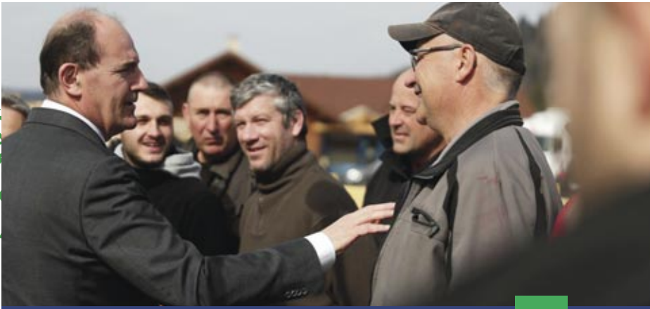
Jean Castex, Premier Ministre, était le 12 mars 2022 à la scierie Grandpierre de Champagnole (39) pour rencontrer les lauréats « Territoires d'industrie » dans le Haut-Jura.