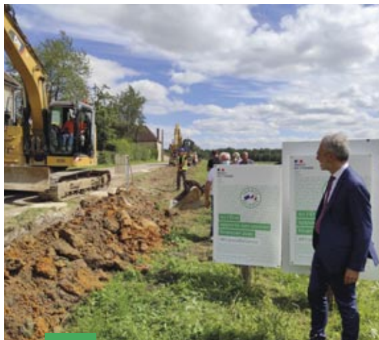
Henri Prévost, préfet de l'Yonne, sur le chantier de forage pour la recherche d'eau souterraine sur la commune de Bléneau (89), porté par la fédération Eaux Puisaye Tonnerre.

41 projets ont été financés , à hauteur de 14,3 millions d'euros de subventions, par les agences de l'eau pour le renouvellement des canalisations et la réhabilitation des réseaux.