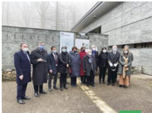
Visite du site de Bibracte (71/58) le 28 janvier 2022 par Roselyne Bachelot, ministre de la Culture

→ Le musée d'Autun (71) qui bénéficiera d'une rénovation dans le cadre du projet Grand Rolin, grâce à une subvention de l'État de 1,5 millions d'euros.